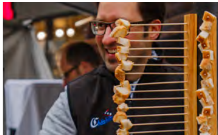
Käsespezialitäten – unter anderem auch Fondue – gab es am Käsefest in Thun zu probieren und kaufen.

➔ volkswirtschaftbeo.ch/organisation/mandate