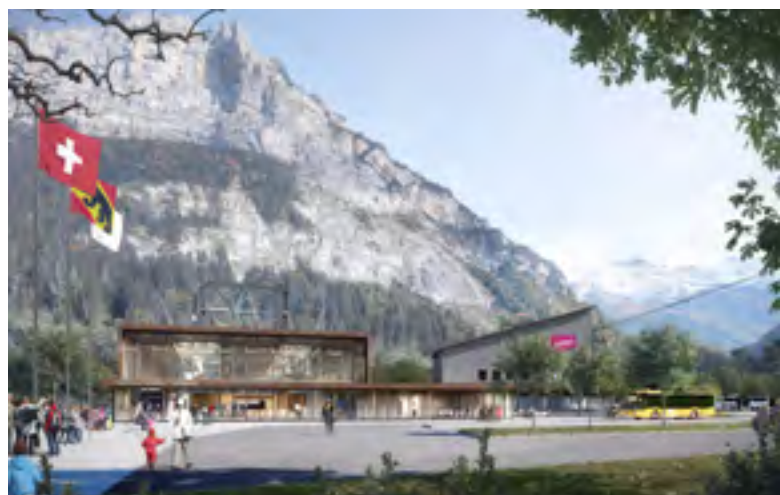
Baukultur und Tourismus: Projekte ermöglichen, Spannungsfelder identifizieren, eine gemeinsame Sprache finden, um Projekte erfolgreich zu realisieren.