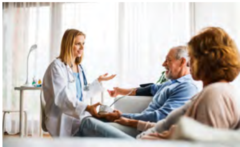
Versorgungsnetz+ Berner Oberland: Das Business-Modell ist bereit für den Einsatz in der Praxis.

Zusammen mit Trägerorganisationen aus Tourismus, Architektur und Heimatschutz konnte dieses NRP-Projekt beim Kanton eingegeben werden. 2025 wurden die Vorbereitungsarbeiten geleistet. Seit September 2025 ist das Projektteam konkret an der Arbeit und plant für 2026 einen ersten Runden Tisch Baukultur und Tourismus.