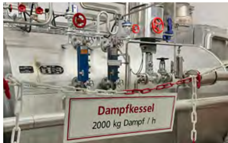
Braukunst aus dem Berner Oberland bei der Rugenbräu AG.