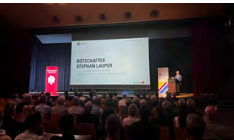
Am Wirtschaftstreffen Berner Oberland stellte Botschafter Stephan Lauper das neue Vertragspaket EU-Schweiz vor.