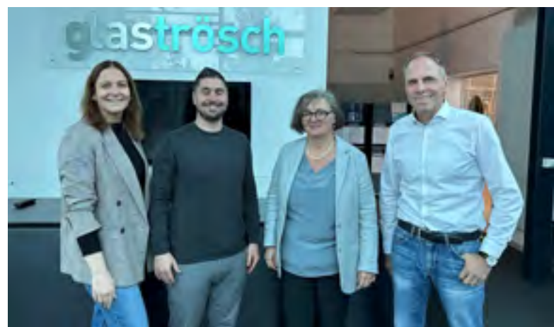
Gemeinsam mit dem Wirtschaftsraum Thun WRT wurde die Glas Trösch AG besucht.