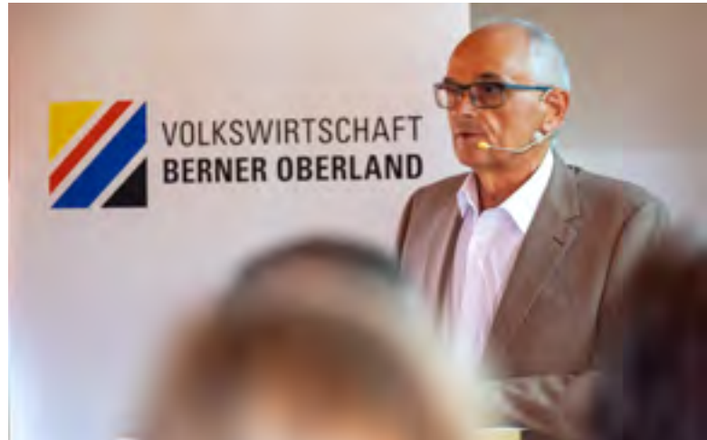
Regierungsrat Pierre Alain Schnegg stellte sich am Gemeindeforum Berner Oberland in Steffisburg den Fragen der Gemeinden.