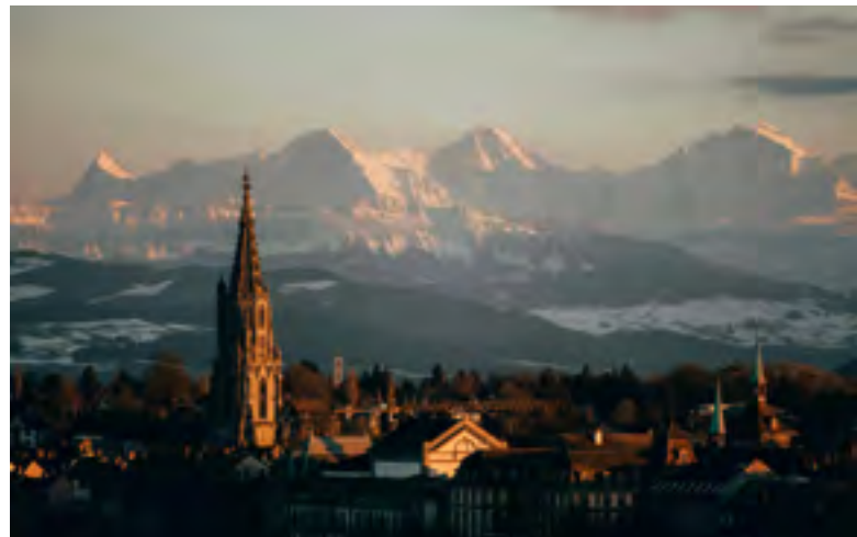
Die Berner Oberländer Grossrätinnen und Grossräte hatten auch im Jahr 2025 den Wirtschafts- und Lebensraum Berner Oberland von Bern aus im Blick.

Auf nationaler Ebene hat sich die Volkswirtschaft Berner Oberland zum Entlastungspaket 2027 geäussert. Insbesondere eine Abwendung von der Neuen Regionalpolitik des Bundes (NRP) wurde in der Stellungnahme klar abgelehnt. Beim Konsultationsentwurf des Raumkonzeptes Schweiz forderten wir, dass die spezifischen Bedürfnisse der Bergregionen stärker berücksichtigt werden.